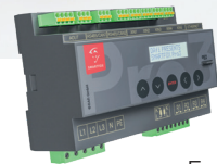
Energiemanager SMARTFOX Pro