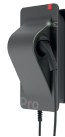
Wallbox SMARTFOX Pro Charger