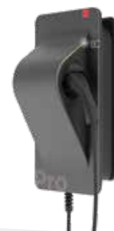
Wallbox SMARTFOX Pro Charger