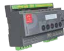
Energiemanager SMARTFOX Pro