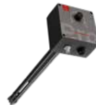
Heizstab SMARTFOX Pro Heater 6K